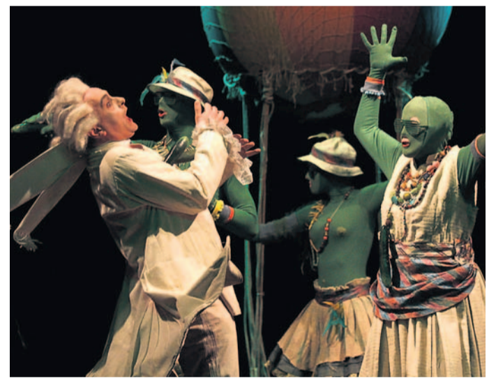
Szene aus „Münchhausen“.

Während das jüngere Publikum diesen Spaß mit spontanen Lachern quittiert, zeigte sich manch älteres Semester verunsichert. Der lange Schatten des Hans Albers ließ grüßen.